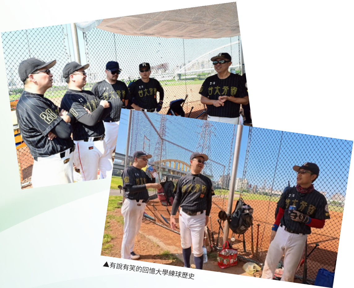
▲有說有笑的回憶大學練球歷史

陳：「我們預計要打到六十歲，對不對？」 詹：「什麼，我們要打到七十!!!」 陳：「七十歲要打軟壘了吧！」（兩人大笑）