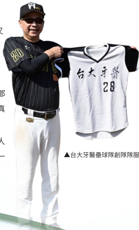
▲台大牙醫壘球隊創隊隊服

還記得民國 82 年七牙冠軍頒獎的時候聽到中山的創辦人講說你們台大人那麼少還能拿冠軍，哈哈哈哈哈（眼神就是一個爽字～）