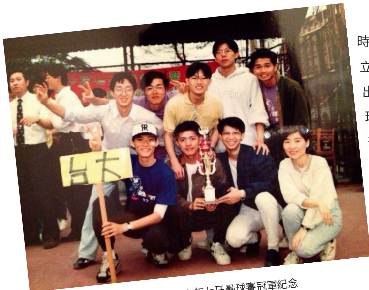
▲ 台大在 1993 年七牙壘球賽冠軍紀念