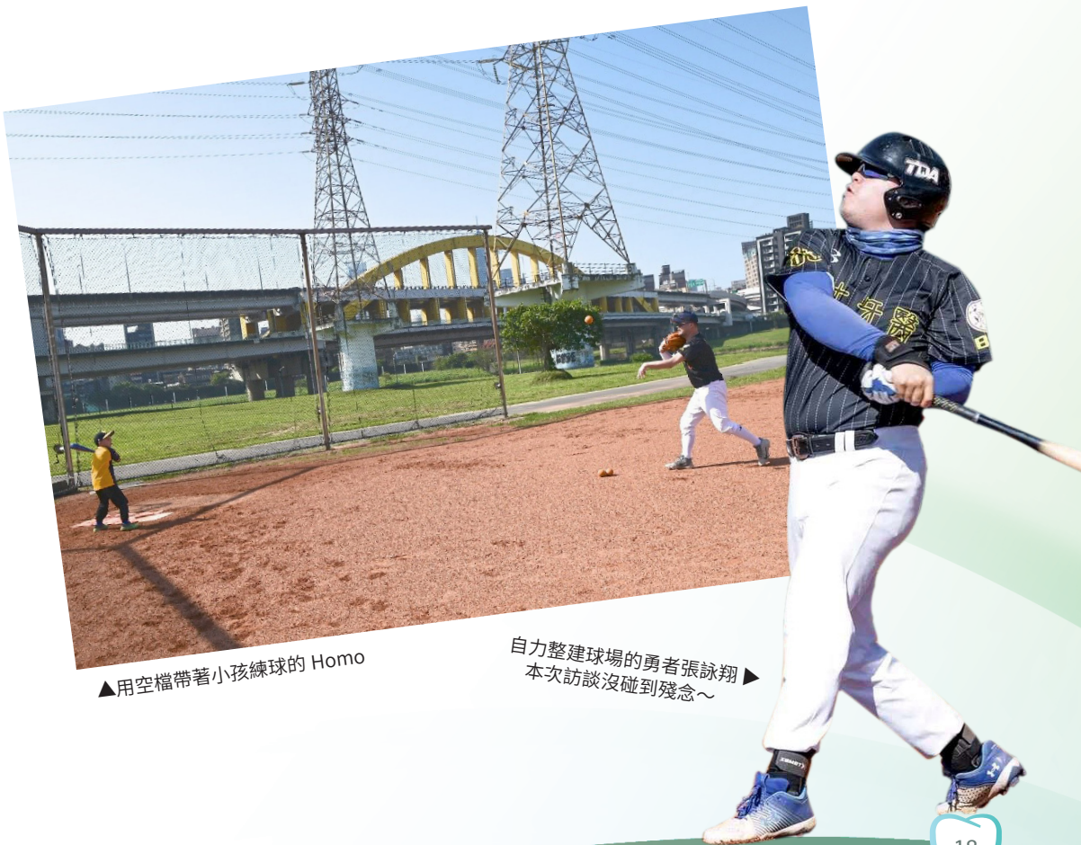
▲用空檔帶著小孩練球的 Homo