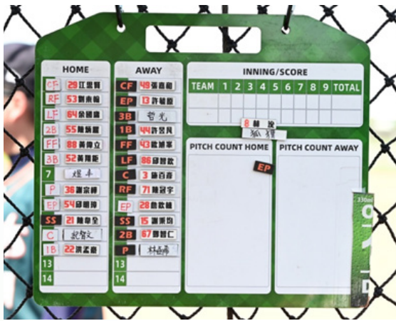
▲北市壘球的隊員與攻守位置

不過最近幾年新加入的人有比較少。今年六月的就業博覽會可以再來放個球衣在校友攤位招募新隊員～